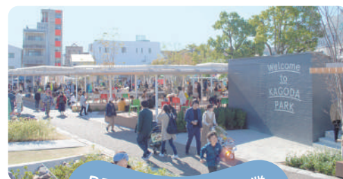
PPP活用公園運営事業 (籠田公園・中央緑道)

休憩スペースが多くある約7,000㎡の籠田公園、道路の再構築により使いやすくなる約6,000㎡の中央緑道での、地元団体や公園管理・活用に関係する民間事業者とともに、公園で稼ぎ、公園に還元する組織・仕組みづくりに挑むプロジェクト