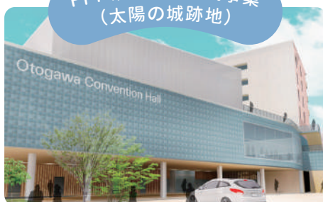
QURUWA PROJECT 1