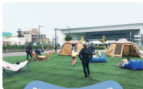
PPP活用拠点形成事業 (暫定駐車場)

図書館交流プラザ「りぶら」東側にある約11,000㎡もの駐車場や広場などの公的不動産を活かした公民連携事業により、まちと「りぶら」をつなぐプロジェクト