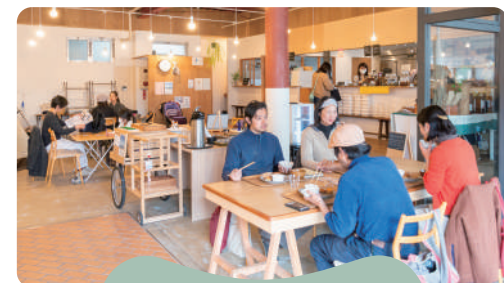
リノベーションまちづくり

遊休化した不動産を活用して、都市や地域の経営課題を複合的に解決し、新たなまちの担い手と来客を呼び込むプロジェクト。籠田公園周辺に魅力的なお店が続々と登場しています。