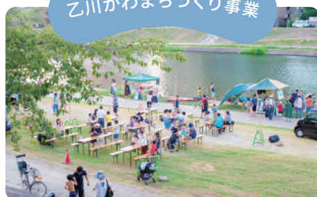
QURUWA PROJECT 4