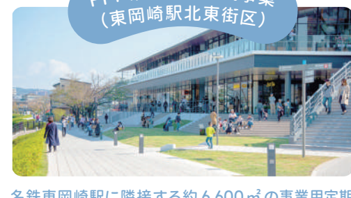
QURUWA PROJECT 3