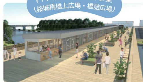
QURUWA PROJECT 2